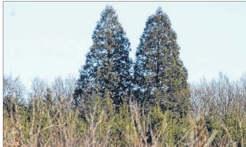
Auch zwei Mammutbäume, die um 1880 im Lenorenwald gepflanzt wurden, zählen zu den Sehenswürdigkeiten der Touren.

Die Broschüre gibt es in den Tourist-Infos in Klütz und Boltenhagen